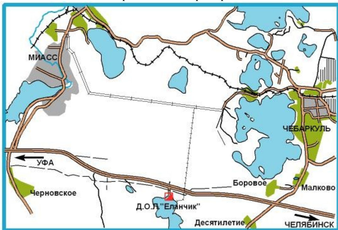
Схема проезда до центра соревнований :

Желательное поступление заявок на проживание – до 31 августа на адрес или по телефону директору соревнований Медведеву Владимиру 89128961900 , 8(35168)25894 . Сюда же должны поступить заявки на встречу спортсменов и доставку до центра соревнований. Самостоятельно от ж\д вокзалов Чебаркуля и Миасса до ДОЛ «Еланчик» можно добраться только на такси(20км).