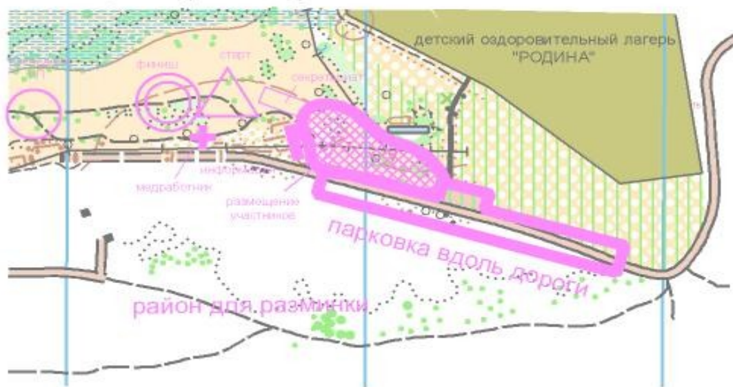
СХЕМА центра соревнований