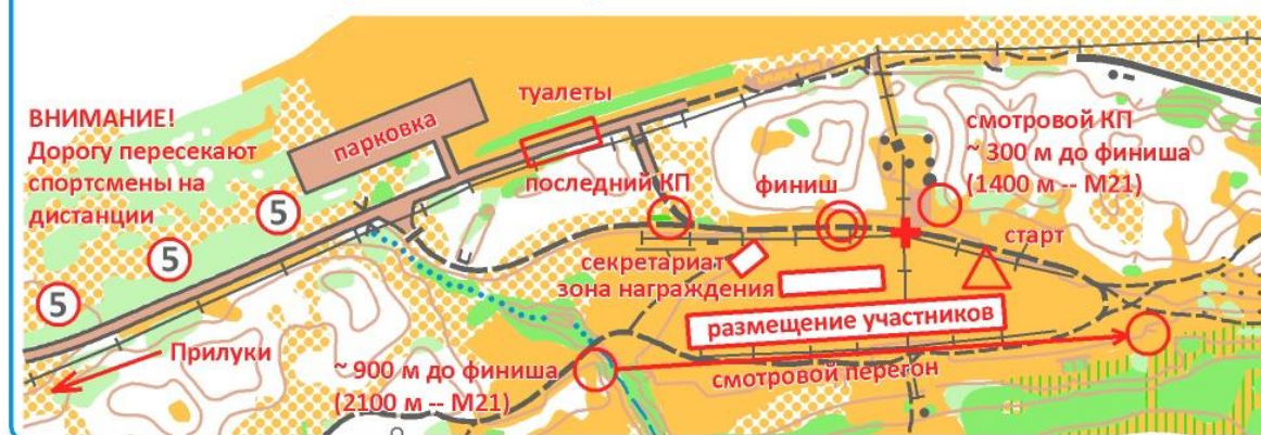
СХЕМА арены соревнований

Старт общий по группам, согласно стартового протокола. Точка начала ориентирования совпадает с техническим стартом. Место спортсмена фиксируется в момент пересечения финишной линии грудью спортсмена, будет использоваться видеозапись. Финишное время фиксируется в момент отметки в финишной станции, в строгой очередности пересечения финишной линии (обгон в финишном коридоре запрещается).