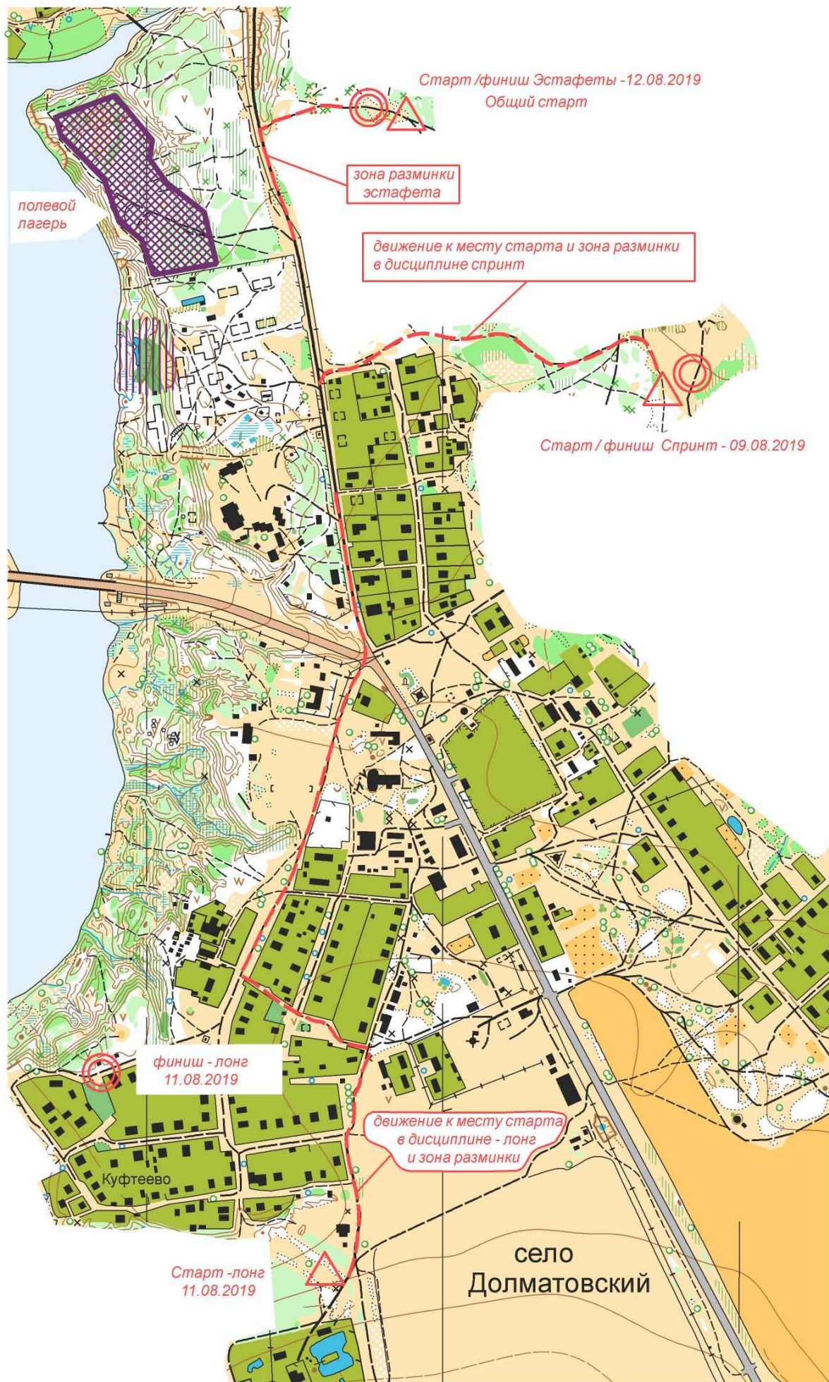
СХЕМА СТАРТОВ 9, 11, 12 августа 2019 г.