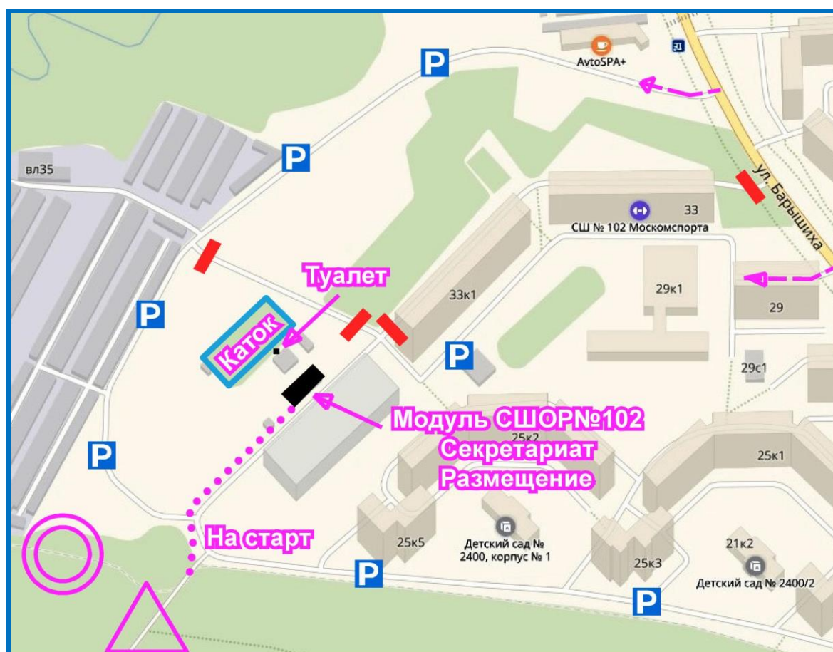
Схема центра соревнований:

Контактный телефон 89161199109 Сухов Артем