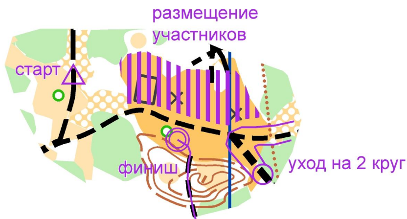
Схема арены соревнований: