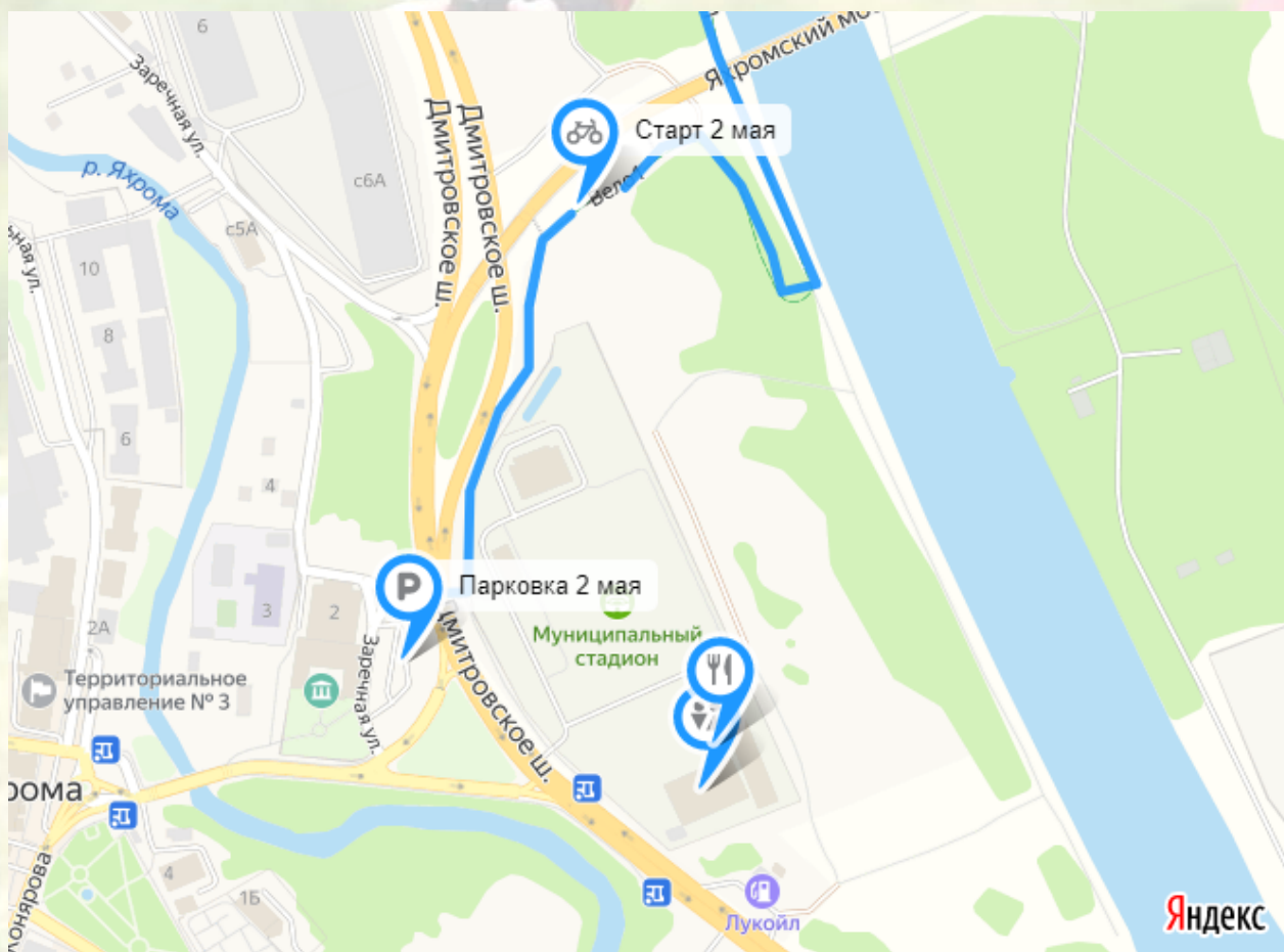
Схема 2 мая на Яндекс Картах: https://yandex.ru/maps/-/CCUFBZSJGA