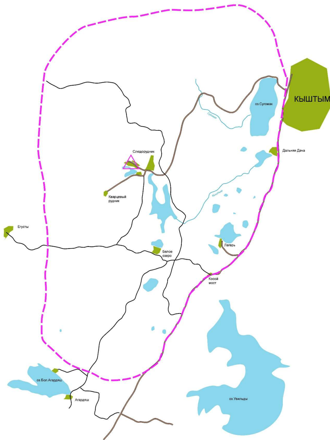
Схема района Чемпионата России по рогейну 2022 года

----- Предполагаемые границы района соревнований