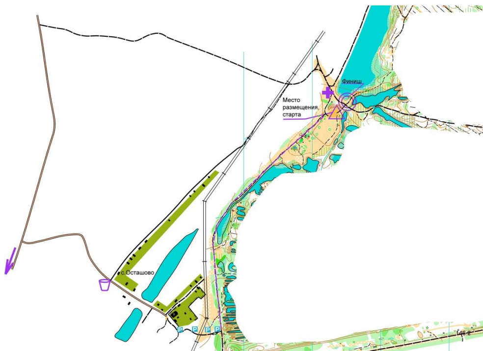
Схема района в картах Яндекс. Район соревнований закрыт для посещения до 13.10.24 – даты проведения.

Электрички Выхино-пл.88 км , далее автобус №32 Воскресенск – Осташово - Потаповское до ост.Осташово, далее пешком до центра соревнований (1-1,2км).